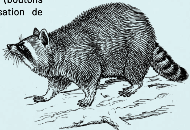
Dans certains endroits, le Trickster est représenté par un raton laveur.